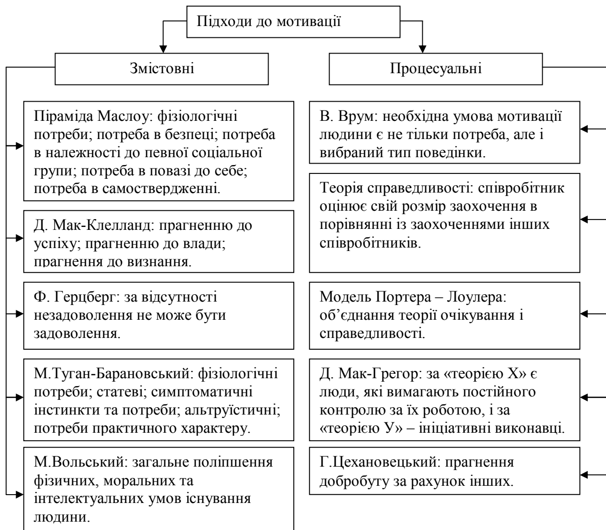
Рис.2. Підходи до мотивації (розроблено на основі [3])

вирішити задачу вибору найбільш ефективних та доцільних заходів впливу. У випадку, коли для підприємства суттєвою є проблема частоті зміни кадрів потрібно застосовувати такі заходи: техніко-економічні (поліпшення умов праці, удосконалення системи матеріального стимулювання і нормування праці, підвищення ступеня автоматизації робіт, розвиток нових форм організації праці); організаційні (удосконалення процедур прийому і звільнення працівників, системи професійного просування, робота з молоддю); виховні (формування у працівників відповідального відношення до праці, свідомої дисципліни, культури поведінки); соціально-психологічні (удосконалення стилю і методів керівництва, взаємин у колективі, системи морального заохочення); культурно-побутові (поліпшення культурно-масової і спортивної роботи, збільшення забезпеченості житлом, дитячими установами, базами і будинками відпочинку).