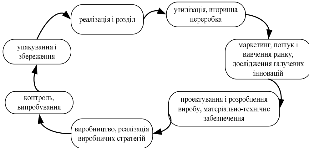
Рис. 2. Маркетингова петля якості промислового підприємства[6, с. 37]

розподілу продукту, де виникає можливість оцінити адекватність вироблених стратегій та планів кон'юнктурі цільових ринків.