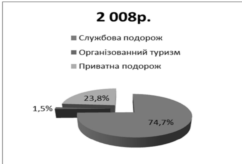
Рис. 2. Мотивація туристичних подорожей громадян В'єтнаму в Україну в 2008 році

Структура туристичного потоку нестабільна - співвідношення мотивацій постійно вагаються. Службові поїздки і приватні подорожі складають більше 90% турпотока з В'єтнаму. За даними державної статистичної звітності (форма N21- ТУР), в 2010 р. українськими туроператорами на території В'єтнаму були обслужені 53 громадяни В'єтнаму, що в 3,4 разу менше, ніж в 2009 р. [5].