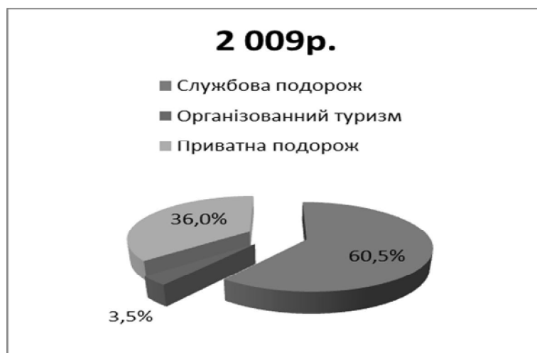
Рис. 3. Мотивація туристичних подорожей громадян В'єтнаму в Україну в 2009 році