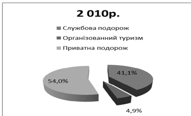
Рис. 4. Мотивація туристичних подорожей громадян В'єтнаму в Україну в 2010 році

Виїзд в 2009-2010 рр., за даними Адміністрації державної прикордонної служби України, українських туристів, мандрівних до В'єтнаму, не зареєстровано; у 2008 році зареєстровано 6 українських туристів, які виїжджали з приватною подорожжю. За 6 місяців 2010 років українців, мандрівних до В'єтнаму, Державною прикордонною службою не зареєстровано. Розбіжності між цими двома джерелами можна пояснити тим, що подорожі до В'єтнаму здійснюються транзитом через інші країни, тому часто перший транзитний пункт фіксується органами пограничного контролю як країна виїзду.