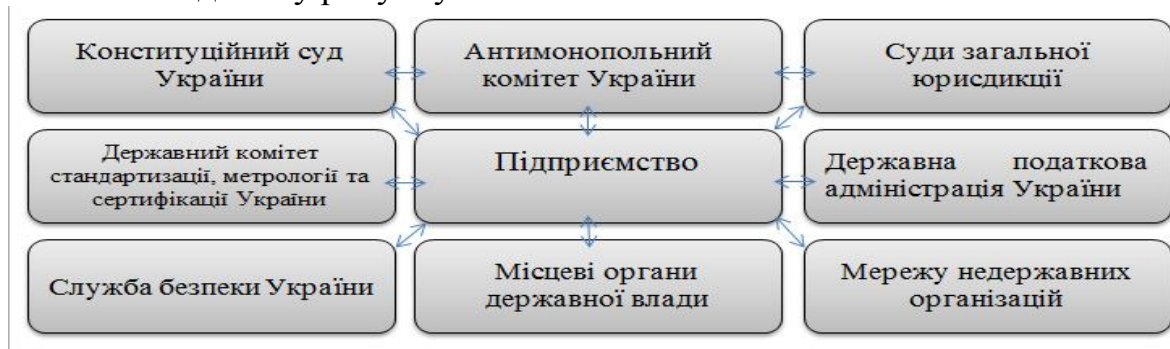
Рис. 1. Взаємозв'язок між підприємством та державними установами з безпосереднім впливом на конкурентну діяльність

Однією з основних економічних функцій української держави є створення умов для добросовісної конкуренції підприємців між собою та державна підтримка діяльності вітчизняних підприємств різних галузей економіки. Законодавство та політика у сфері конкуренції повинні розглядатись, як важливі елементи ринкових реформ, головною метою яких є створення розвинутої економіки. Управління та контроль у сфері підприємництва здійснюється за рахунок прив'язки конкуренції до державних ринкових умов. У цій ситуації важливу роль відіграє антимонопольна діяльність, яка встановлює правила поведінки на ринку, захищає підприємців та споживачів від антиконкурентних дій інших суб'єктів ринку, сприяє формуванню конкурентного середовища та встановлює відповідальність та систему санкцій за порушення вимог законодавства про захист економічної конкуренції. Державні установи, які мають безпосередній вплив на діяльність суб'єктів господарювання схематично наведені у рисунку 1.