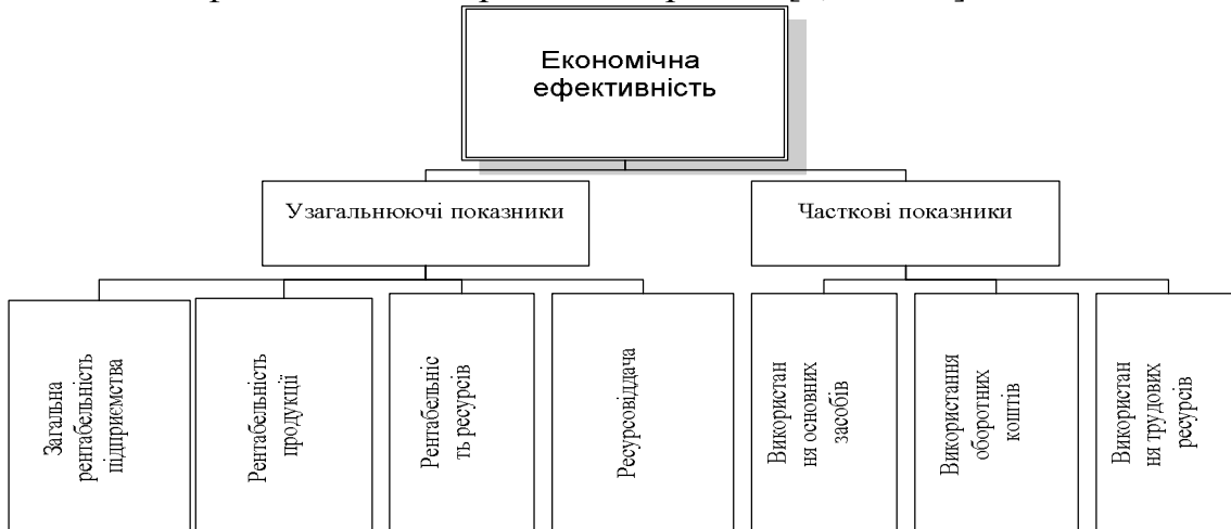
Рис. 2. Система показників економічної ефективності підприємства

Економічна ефективність передбачає збільшення ефекту при досягнутих за попередній період (базових) витратах виробництва. Ефектом у такому випадку виступає сума отриманого прибутку. Систему показників економічної ефективності зображено на рис. 2. [6, с. 9-11].