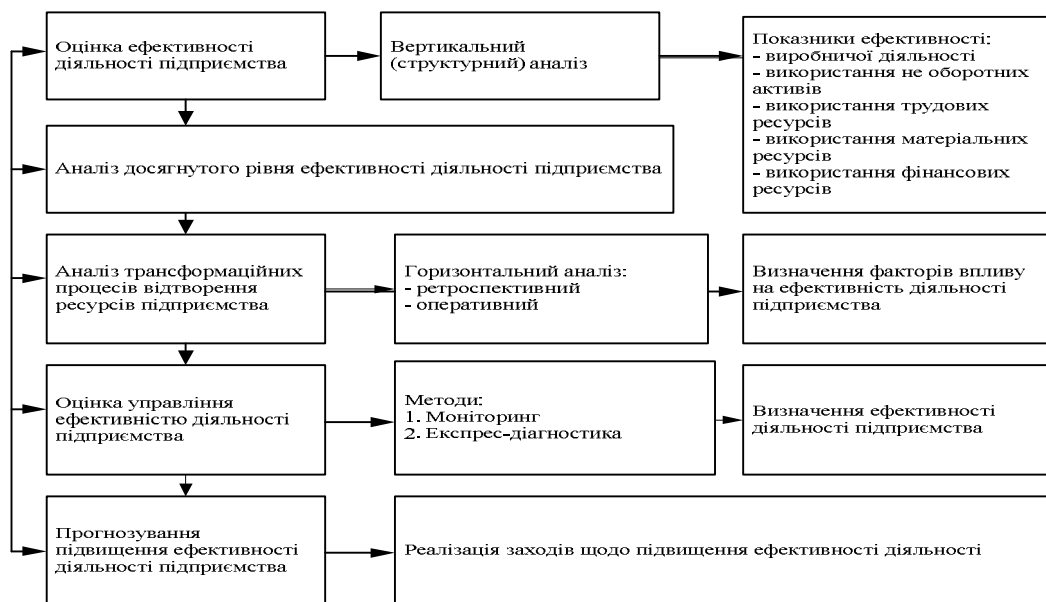
Рис. 3. Алгоритм забезпечення ефективності діяльності підприємства