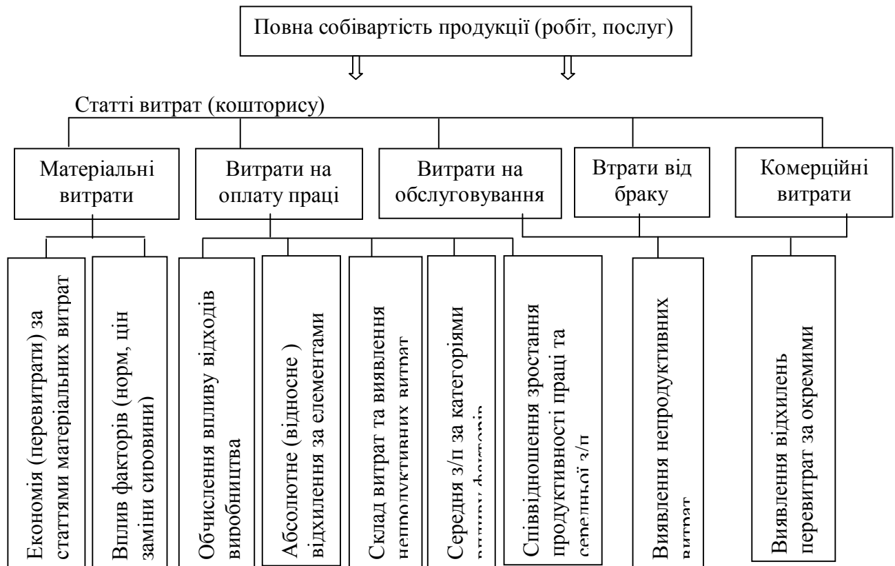
Рис. 1. Схема аналізу повної собівартості продукції (робіт, послуг) [1, с.20].

III етап - аналіз узагальнюючих показників витрат виробництва на 1 гривню товарної продукції та реалізованої продукції. Цей показник може застосовуватися в будь-якій галузі і наочно відображує прямий зв'язок між собівартістю та прибутком. Якщо собівартість товарної продукції подати як суму добутків собівартості одиниці продукції по кожному найменуванню продукції на кількість виробів, а обсяг товарної продукції – як добуток кількості продукції на її ціну, то формула для розрахунку рівня витрат на 1 грн. товарної продукції буде такою (формула 2):