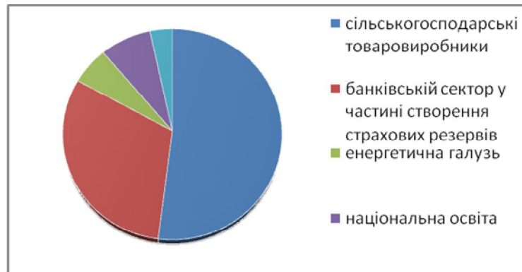
Рис. 2. Преференції держави за секторами економіки

Дані рис. 2. свідчать про пріоритетність пільгового фінансування сільського господарства та банківського сектору у частині створення страхових резервів. Також під державним контролем перебуває енергетична галузь, преференції на яку, порівняно з минулим роком, зросли на 18 %, літакобудування та національна освіта.