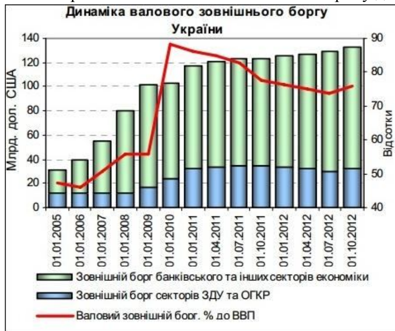
Рис. 1. Динаміка валового зовнішнього боргу України

Виклад основного матеріалу. Валовий зовнішній борг України на кінець першого півріччя 2014 року становив 136.8 млрд. дол. США, скоротившись порівняно з початком року на 5.3 млрд. дол. США (на 3.7%). Така позитивна динаміка пов'язана зі зменшенням обсягу зовнішніх зобов'язань приватного сектору на 7.4 млрд. дол. США, тоді як державний борг збільшився за рахунок залучення Урядом офіційних кредитів. Відносно ВВП борг збільшився з 78.1% на початок року до 81.8%.