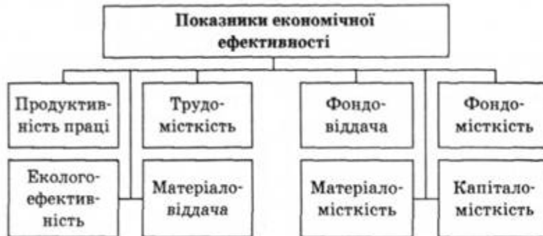
Рис. 2. Показники економічної ефективності

Для визначення ефективного використання кожного фактора виробництва окремо, застосовується система конкретних показників: продуктивність праці, трудомісткість, фондівіддача, фондомісткість, матеріалівіддача, матеріаломісткість, капіталомісткість тощо (рис.2).