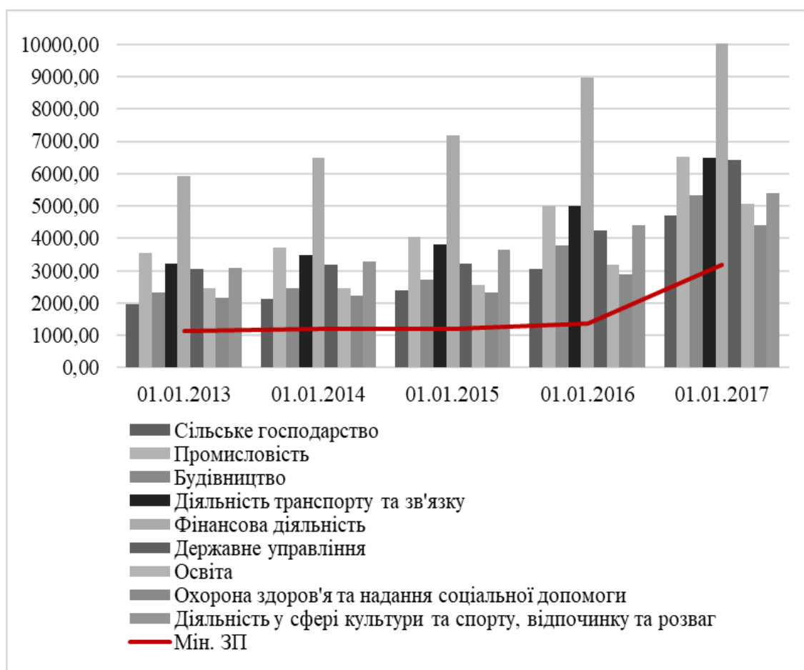
Рисунок 2 – Динаміка зміни середньої заробітної плати за галузями та мінімальної заробітної плати в Україні за 2013-2017 роки, грн.