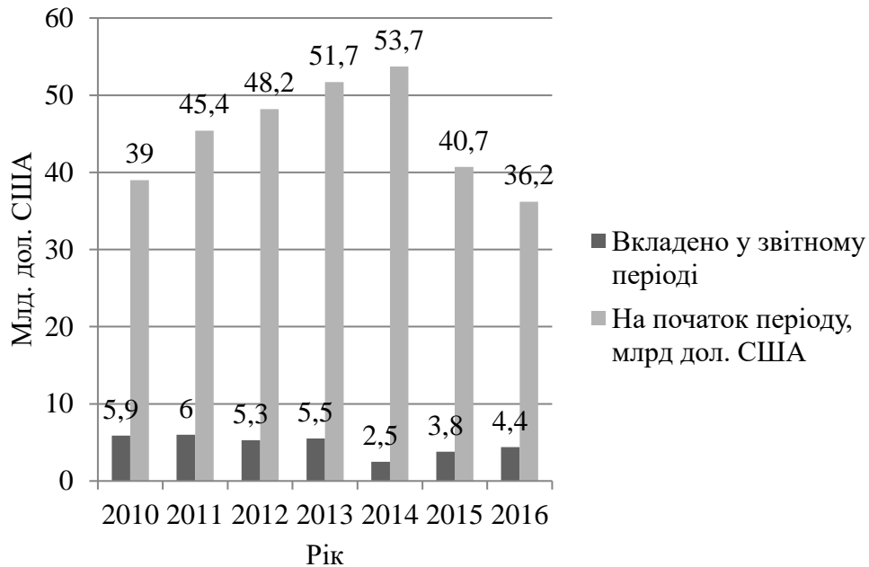
Рис. 1. Обсяг прямих іноземних інвестицій, млрд. доларів США [5]

У 2016 році Україна отримала 4405,8 млн.дол. США прямих інвестицій проти 3763,7 млн.дол.США у 2015 році (рис 1).