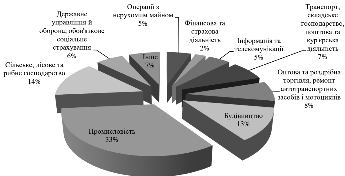
Рис. 2. Розподіл освоєних капітальних інвестицій за сферами економічної діяльності (у % до загального обсягу) [5]

Головним джерелом фінансування капітальних інвестицій українських підприємств є власні кошти. Частка кредитів банків та інших позик у загальних обсягах капіталовкладень становила 7,1 відсотка. Кошти іноземних інвесторів складають 2,9% усіх капіталовкладень. На державні та місцеві бюджети припадає 9,4% капітальних інвестицій. Частка коштів населення на будівництво житла – 8,9%, інші джерела фінансування – 2,3% усіх капіталовкладень (рис. 3).