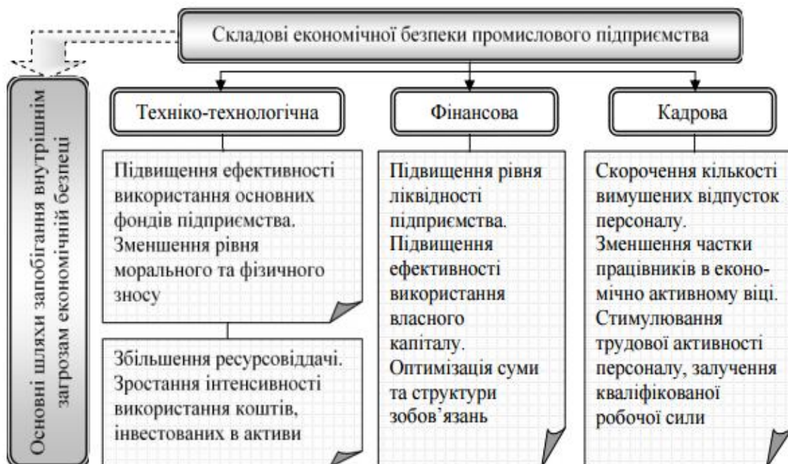
Рис. 1. Шляхи запобігання внутрішнім загрозам економічній безпеці підприємства Джерело: [6]