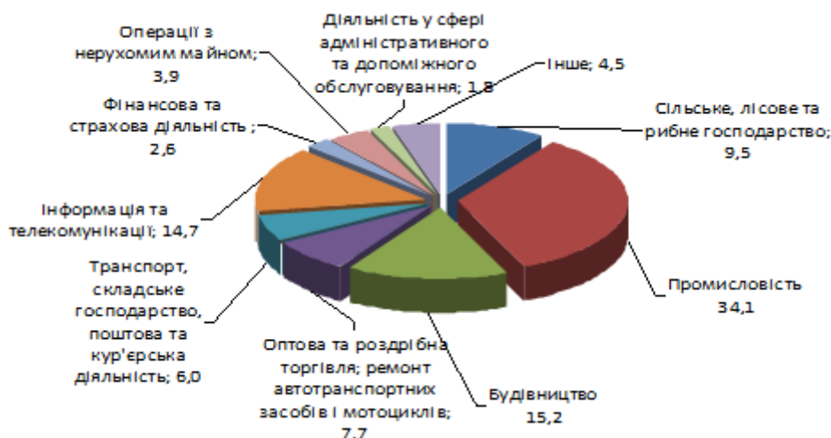
Рис. 1. Розподіл освоєних капітальних інвестицій за сферами економічної діяльності (у % до загального обсягу) [4]

рахунок яких у січні – червні 2015 року освоєно 69,3 % капіталовкладень (рис. 2).