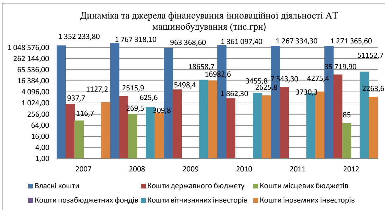
Рис.1 Динаміка та джерела фінансування інноваційної діяльності АТ машинобудування, 2007-2012 рр.

Дещо більшою є частка інших джерел фінансування інноваційної діяльності від 0,4% у 2008 році до 11% у 2012 році. У 2007 р. з загальної суми взятих кредитів майже 10% було взято на пільгових умовах в 2008р. тільки 2,8%, а з 2009р. кредити на пільгових умовах більше не надавались.