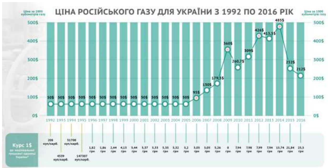
Рисунок 1 – Підвищення цін газу для України з 1992-2016 рр.

В період з 2015-2016 рр. спостерігаються критичні зміни та погіршення експортно-імпортних операцій. Хіміко-будівельна галузь, що посідала одне з найвищих позицій за експортом, значно погіршила своє становище. Так, за підсумками 2017-го року, продукція хіміко-будівельної промисловості за експортом товарів складала лише 3,8%.