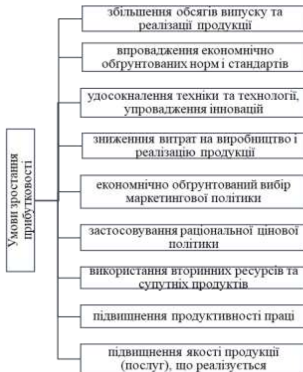
Рисунок 3 – Резерви зростання прибутковості діяльності підприємств

розпоряджається підприємство. Максимальна мобілізація резервів собівартості продукції є важливою умовою ефективного функціонування підприємства [7, с. 254]. На витрати виробництва та реалізацію продукції впливають всі чинники витрат, виражені у грошовій формі, а саме: основних фондів, сировини, матеріалів, палива, енергії, трудових ресурсів. Це найважливіший внутрішньовиробничий показник, який впливає на збільшення прибутку підприємства. Звідси визначається й основне завдання підприємства для збільшення прибутку – визначити оптимальне співвідношення між витратами та доходами, що є найважливішою умовою ефективної діяльності підприємства.