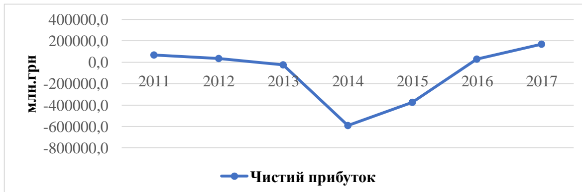
Рисунок 1 – Чистий прибуток (збиток) вітчизняних підприємств за період 2011-2017 рр.

результат підприємств був додатнім, тобто підприємства отримали прибутки у розмірі від 67797,9 млн. грн. у 2011 році до 35067,3 млн. грн. у 2012. В період з 2011 по 2013 розмір чистого прибутку зменшився майже на 86%, а у 2014 підприємства отримали збиток у розмірі 792771,4 млн. грн. [2].