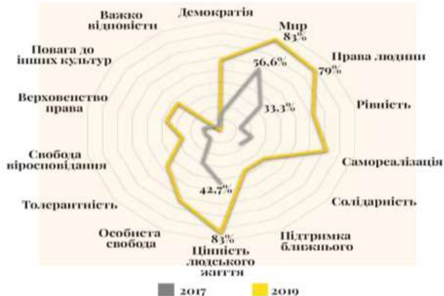
Рисунок 1 – Європейські цінності в ціннісній системі українців*

цінностей, розроблений у рамках міжнародного проекту «Євробарометр» [2], який здійснюється під егідою Європейської Комісії. Результати нашого опитування продемонстрували, що найбільшою цінністю із запропонованого переліку для респондентів є «мир» та цінність людського життя, що становить 83% кожен (рис. 1). У 2017 році ці частки хоч і переважали, але становили 56,6% та 42,7% відповідно. Найменш цінними є свобода віросповідання – 26%, у 2017 році це була «повага до інших культур» – 5,4%. Варто відзначити, що ТОП-3 цінностей європейців такі ж як в українців і 2019, і 2017 років.