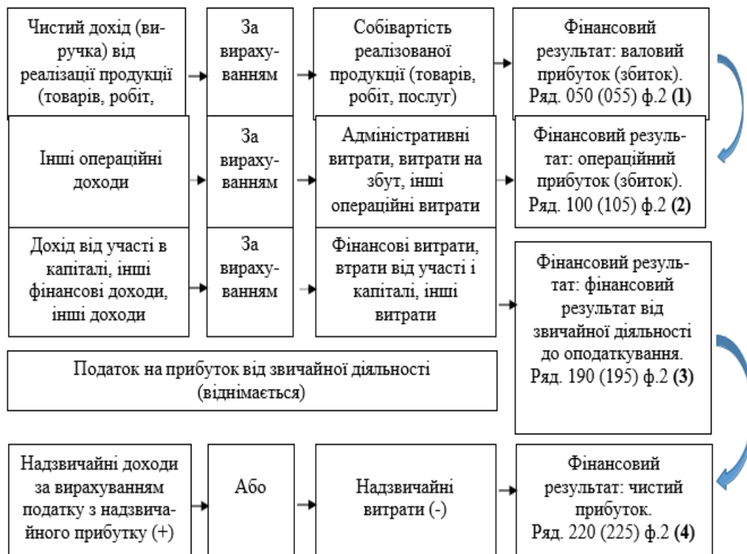
Рисунок 2 – Процес формування фінансових результатів підприємства